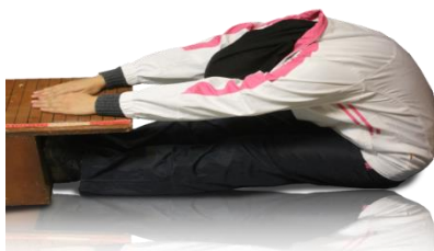
آزمون انعطاف پذیری